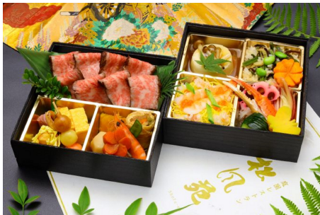
④: 松風苑膳 ステーキ