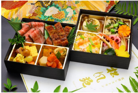
①: 松風苑膳 合盛