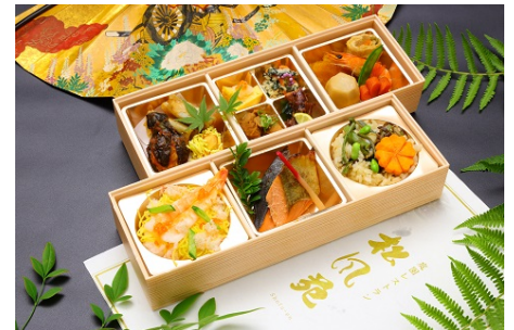
⑥: 幕の内二段 焼魚