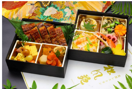
⑤: 松風苑膳 鰻