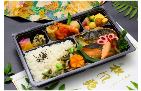
③: 幕の内弁当 焼魚