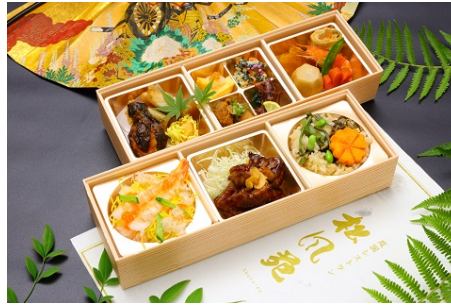
②: 幕の内二段 とんてき