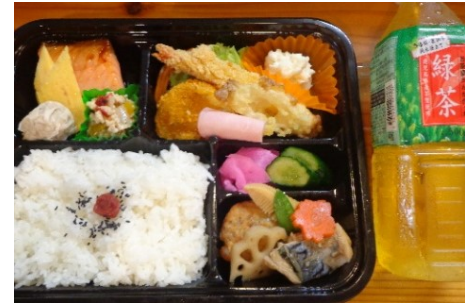
③: イベント弁当(お茶付)