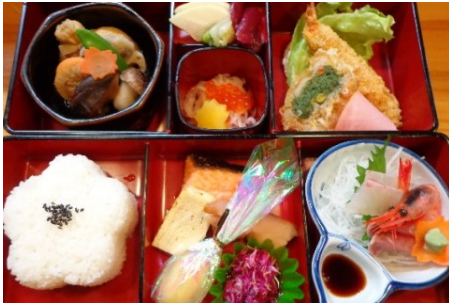
①: 仕出し弁当 二段